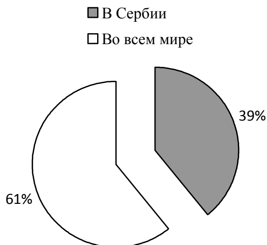
Рис. 3. Соотношение медиа-сообщений о миграционных процессах в Сербии и во всем мире.

На рис. 4. представлено соотношение наличия в медиа-сообщениях информации о глобальных миграционных процессах и об эмиграциях на национальном уровне. Как видно на круговой диаграмме, большая часть новостей (93,04%) посвящена глобальным миграциям, а проблемы эмиграций на национальном уровне затрагивает незначительная часть медиа-сообщений (6,96%).