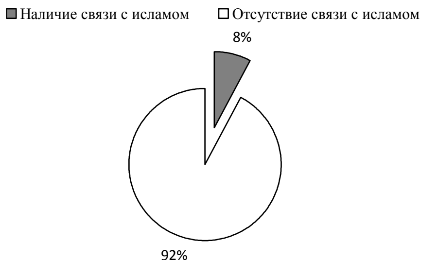
Рис. 2. Связь в медиа-сообщениях миграций и ислама

На круговой диаграмме, представленной на рис. 2, видно, что в большинстве новостных сообщений о мигрантах прямо не говорится об исламе (92,17%), в то время как небольшое количество медиа-сообщений упоминает некую связь миграций и ислама (7,83%).