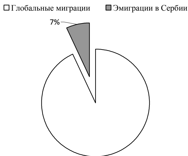
Рис. 4. Соотношение медиа-сообщений о глобальных миграционных процессах и эмиграциях на национальном уровне.

На рис. 4. представлено соотношение наличия в медиа-сообщениях информации о глобальных миграционных процессах и об эмиграциях на национальном уровне. Как видно на круговой диаграмме, большая часть новостей (93,04%) посвящена глобальным миграциям, а проблемы эмиграций на национальном уровне затрагивает незначительная часть медиа-сообщений (6,96%).