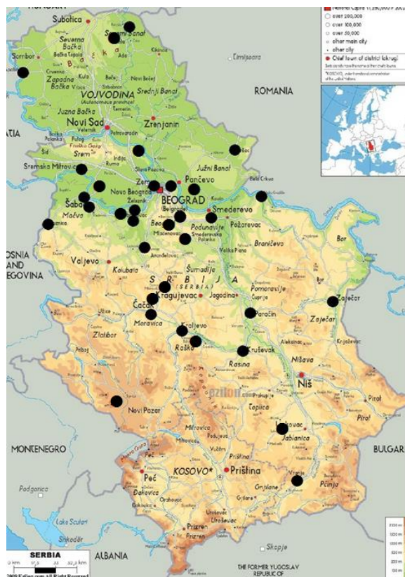
Slika 1. Plantaže Miscanthus × giganteus Greef et Deu koje su podigle istraživačke organizacije u Republici Srbiji

generisanje vodonika postupkom gasifikacije. Nekorišćeno poljoprivredno zemljište po statističkim regionima u Republici Srbiji prikazano je u Tabeli 2.