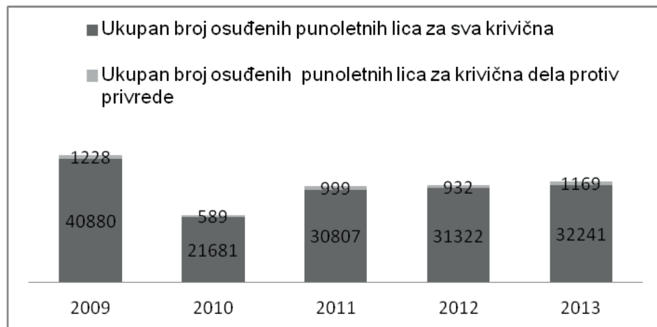
Grafikon 2: Ukupan broj osuđenih punoletnih lica za sva krivična dela / za krivična dela protiv privrede

Izvor: Republički zavod za statistiku 13