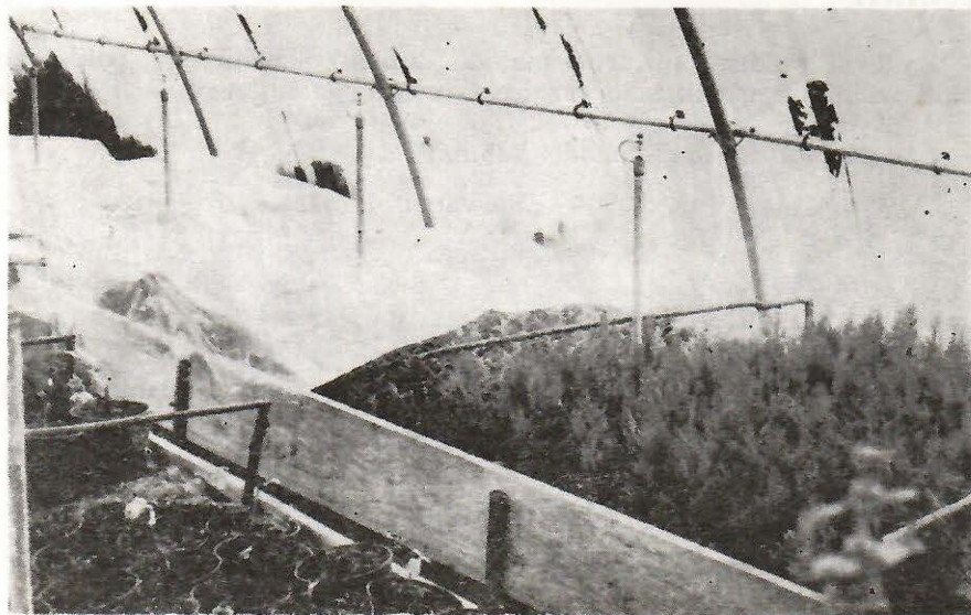
Sl. 2. Plastična folija uklonjena sa dela leje