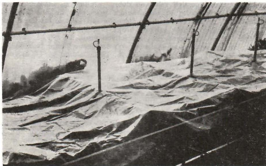
Sl. 1. Plastična folija prebačena preko reznica odmah po postavljanju na ožiljavnje

Pre desetak godina podigli smo plastenik P—270 proizvodnje Brodoimpeks-a koji je pokriven sa pločama Valoplast. Plastenik je dužine 16 metara i širine 7,5 m u kome su izgrađene četiri leje za ožiljavanje od kojih je svaka bila obezbeđena sa linijom za veštačku izmaglicu (mist). Dve leje su postavljene direktno na zemlju, a dve su podignute na visinu od 70 cm. Jedna od podignutih leja je korišćena za ožiljavanje pod plastičnom folijom. Osnova svake leje je bila ispunjena šljunkom od 5 do 7 cm u prečniku dok je preko tog sloja bio postavljen pesak u proseku 2—3 mm u prečniku u koji su postavljene reznice. Pre postavljanja folije, u istoj leji su na jednakom rastojanju postavljene lukovi koji su držali plastiku da ne padne preko reznica već da bude u nivou vrhova. Folija nije nigde bila pričvršćena, tako da je bilo moguće podizati je po potrebi radi bolje ventilacije. Izgled leje sa plastičnom folijom postavljenom preko reznica dat je na slici 1., dok je izgled iste leje sa lukovima i folijom uklonjenom sa dela leja dat na slici 2.