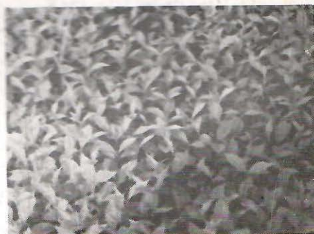
Balirane sadnice iz kontejnera Plantagrah I i II i „GORA 78”