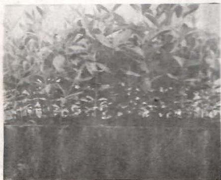
Sibirski brest (Ulmus pumila var. pinnato-ramosa Dieck.), star 5 meseci, proizveden u kontejneru Plantagrah I...

savremeni sistemi rasadničke proizvodnje