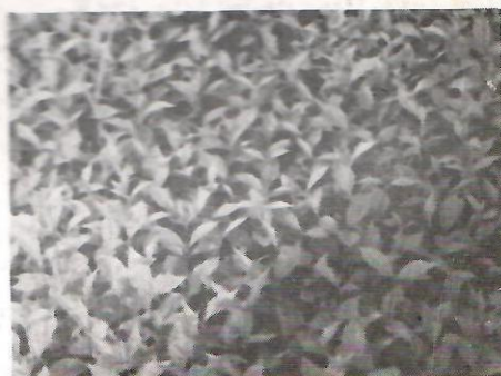
Balirane sadnice iz kontejnera Plantagrah I i II i „GORA 78”