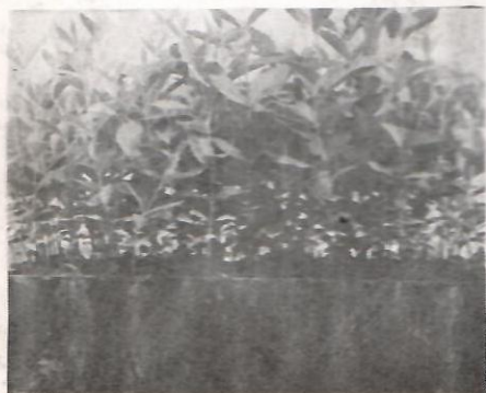
Sibirski brest (Ulmus pumila var. pinnato-ramosa Dieck.), star 5 meseci, proizveden u kontejneru Plantagrah I...

savremeni sistemi rasadničke proizvodnje