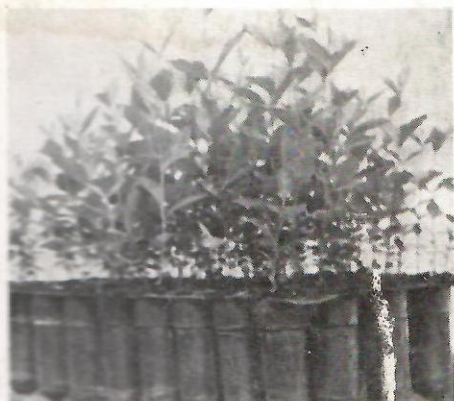
Isti brest u kontejneru „GORA 78”