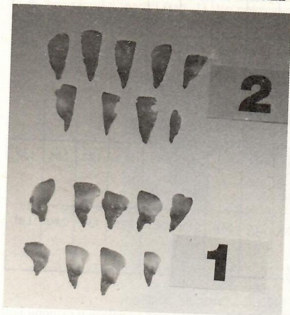
Sl. 2. Semenke: 1 Abies alba Mill., 2 Abies alba var. pyramidalis Carr.

Vrh stabla na kome se javljaju šiškarkice je nepristupačan. Šišarke su bile u raspadanju, te je trešenjem vrha uhvaćen izvestan broj semenki. Već na prvi pogled vidimo jasnu razliku između krioca semenki obične i piramidalne jele (sl. 2).