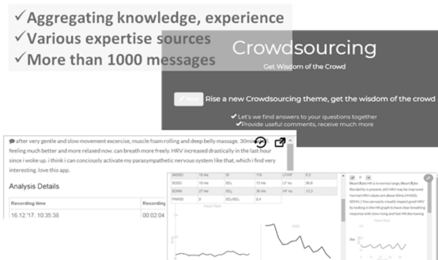
Sl. 4. Crowdsourcing portal

koji ističu važnost HRV analize u predikciji zdravstvenih promena [11] i [12]. HRV podaci nose informaciju o balansu unutar autonomnog nervnog sistema kao i o nivou fizičke kondicije i stresa. Za unapređenje mnogih parametara potrebno je izvršiti agregaciju ekspertskog znanja i iskustva iz više oblasti. Upravo mogućnost agregacije koja je dostupna ljudima bilo gde da se nalaze i u svakom trenutku je jedna od osnovnih ideja pokretanja Crowdsourcing portala koji je prikazan na Sl. 3. Preko 1000 poruka je obrađeno na Crowdsourcing portalu.