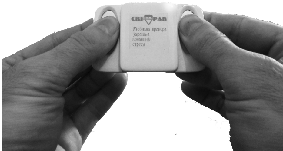
Sl. 2. Upotreba EKG uređaja bez elektroda