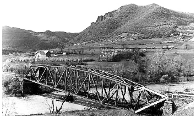
Слика 7. Срушен мост Туснић. 45