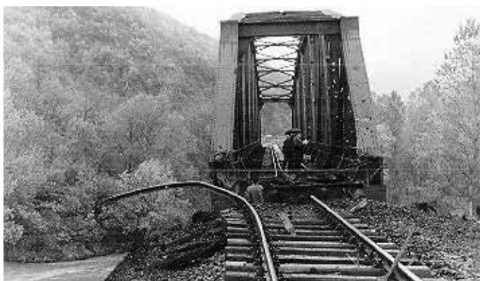
Слика 3. Оштећени мост Пивница на реци Ибар, снимак из правца Рашка. 41