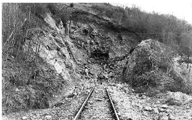
Слика 6. Зарушени улазни портал тунела Шарпељ. 44