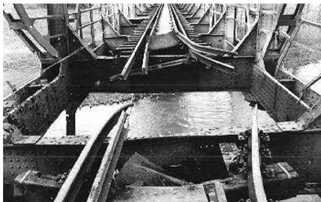
Слика 5. Оштећено средње поље железничког моста Шарпељ. 43