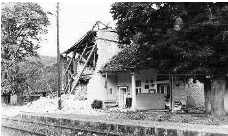
Слика 1. Срушена Железничка станица Богutowачка Бања. 39

Током бомбардовања оштећено је 18 мостова, три тунела, 22 железничке станице, 36 осталих железничких зграда, 19 прекида и оштећења пруга, 87 осталих објеката и постројења. Возна средства бомбардована су 11 пута, а остала средства четири пута. 38