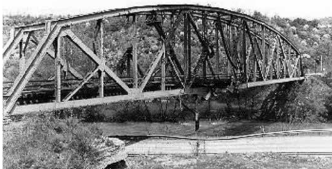
Слика 4. Железнички мост Лучица 2. 42