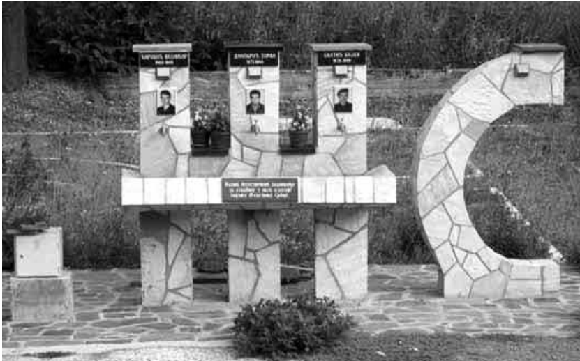
Слика 8. Споменик погинулим железничарима током НАТО бомбардовања у Јошаничкој Бањи. 49