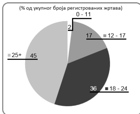
Графикон број 2.