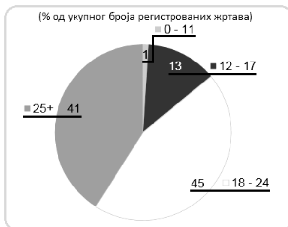
Графикон број 4.