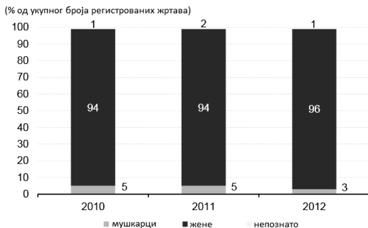
Графикон број 3.

По подацима Еуростата (Eurostat) 15 у обрађиваном трогодишњем периоду, највећи број регистрованих жртава трговине људима су уствари жртве сексуалне експлоатације (69% од укупног броја) при чему као жртве предњаче жене са чак 95%, док је 4% мушких жртви (графикон број 3). Стога је донекле и очекивано што се у ширим круговима друштва трговина људима поистовећује са сексуалном експлоатацијом, односно присилном проституцијом.