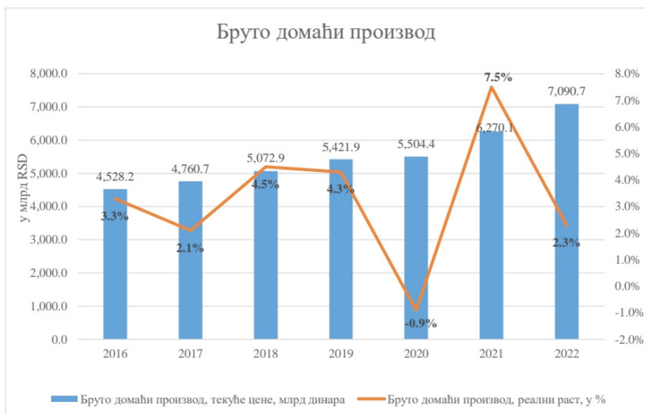
Слика 1. Кретање БДП-а у периоду од 2016. до 2022. године. 28

На слици број 1. примећујемо да су током 2022. године „половично испуњене вредности показатеља ефекта на нивоу општег циља Програма реформе управљања јавним финансијама 2021-2025. Показатељ који се односи на реални раст БДП (од 4% циљане вредности, на бази кварталног обрачуна остварена је вредност 2,3%), а показатељ нивоа дуга опште државе у БДП-у (од 57,9% циљане вредности премашен за 2,3 п.п. и износи 55,6%).