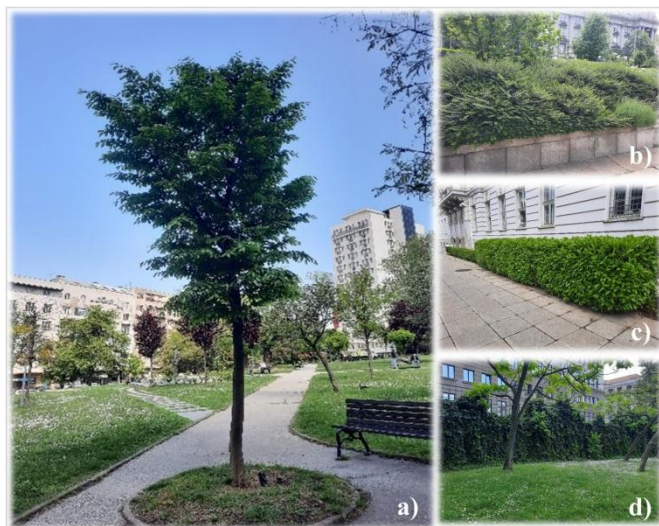
Slika 2 - a) Detalj parterne pejzažnoarhitektonske kompozicije sa drvećem, b) Grupa žbunja na kosini, c) Oblikovana živa ograda i d) Penjačica u vertikalnom ozelenjavanju

taksona drveća (41 individua, od kojih je najviše stabala (15) Pinus nigra J.F.Arnold) i jedna žbunasta vrsta - Juniperus x pfitzeriana (Späth) P.A.Schmidt (na površini 23,1 m 2 ) – golosemenica; 31 takson drveća (131 inividua, od kojih je najviše stabala (20) Tilia cordata Mill.), 12 žbunastih (od kojih je pod najvećom površinom od 43,4 m 2 Prunus laurocerasus Thunb., a to je i vrsta u svim živim ogradama) i jedna penjačica - skrivenosemenica. Iskazana distribucija dendrofonda izdvaja drveće kao dominantno (73,6%), slede žbunje u procentu 24,5 i penjačica 1,9.