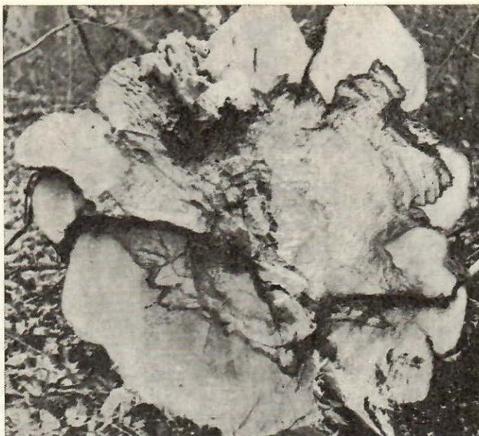
Sl. 5. Izgled truleži na preseku panja. Ovu fazu karakterišu zone različito obojenog drveta ograničene mrkim linijama. Aktivnost gljive mestimično zahvata beljiku izaziva njenu trulež i nekrozu kore. Južni Kučaj — Palčina, 1971.