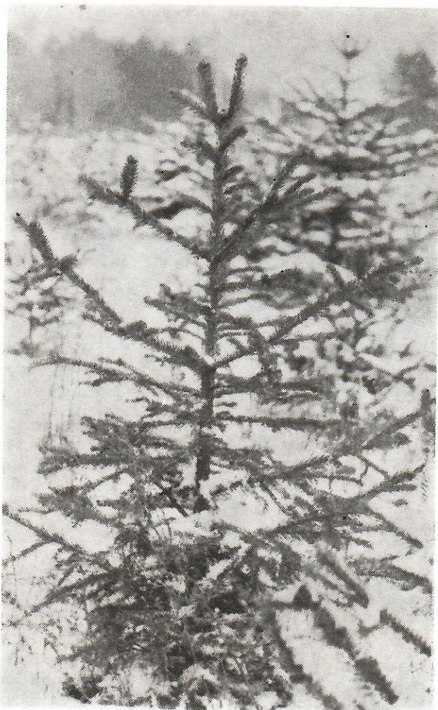
Sl. 3. Kojamajeva smrča stara 8 godina. Vide se oštećenja od mraza na terminalnim granama (Orig).

1983. do kraja 1988. su se kretali bez neke pravilnosti, od 5,0 cm do 18,0 cm, tako da ukupne visine biljaka posle osam godina rasta i razvoja u rasadničkim uslovima ne dostižu ni jedan ceo metar. Moglo bi se reći da je razlog tome što vrsta pripada drveću nižeg reda, pa čak i patuljastoj formi, međutim, na ovom lokalitetu, iz godine u godinu, stabalca su oštećivana niskim temperaturama, te je i to učinilo da su biljke imale tako slab porast.