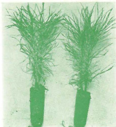
Sadnice Pinus nigra starosti 5 me- seci izvučene iz kontejnera.