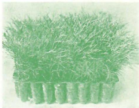
Kontejner G.O.R.A. sa sadnicama Pinus nigra starosti 4 meseca