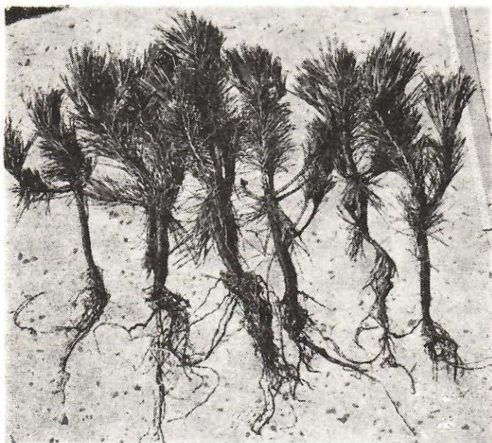
Sadnice crnog bora po završenoj četvrtoj vegetaciji (3 sadnice na levoj strani pripadaju provenijenciji sa krečnjaka, a 3 na desnoj su sa serpentina)

noj godini (već u narednoj godini nije se ponovio). Možda bi se bolji plasman provenijencije sa krečnjaka pre mogao pripisati suši koja je u 1985. godini bila veoma jaka i dugotrajna, a kojoj je ova provenijencija bolje odolevala.