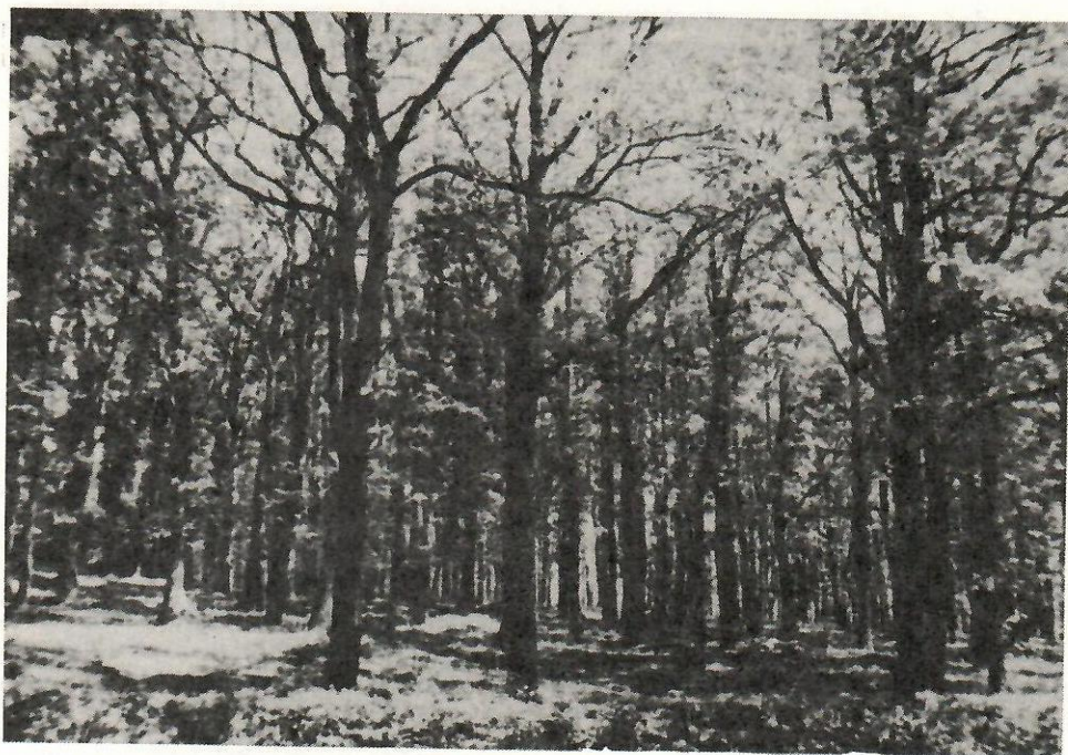
Slika 1. – Karakterističan detalj šume virgilijskog hrasta u okviru parkovskog dela

južnog obodnog dela panonske nizije, područja koje se odlikuje nizom specifičnosti u pogledu singeneze, ekološkog i istorijskog razvitka.