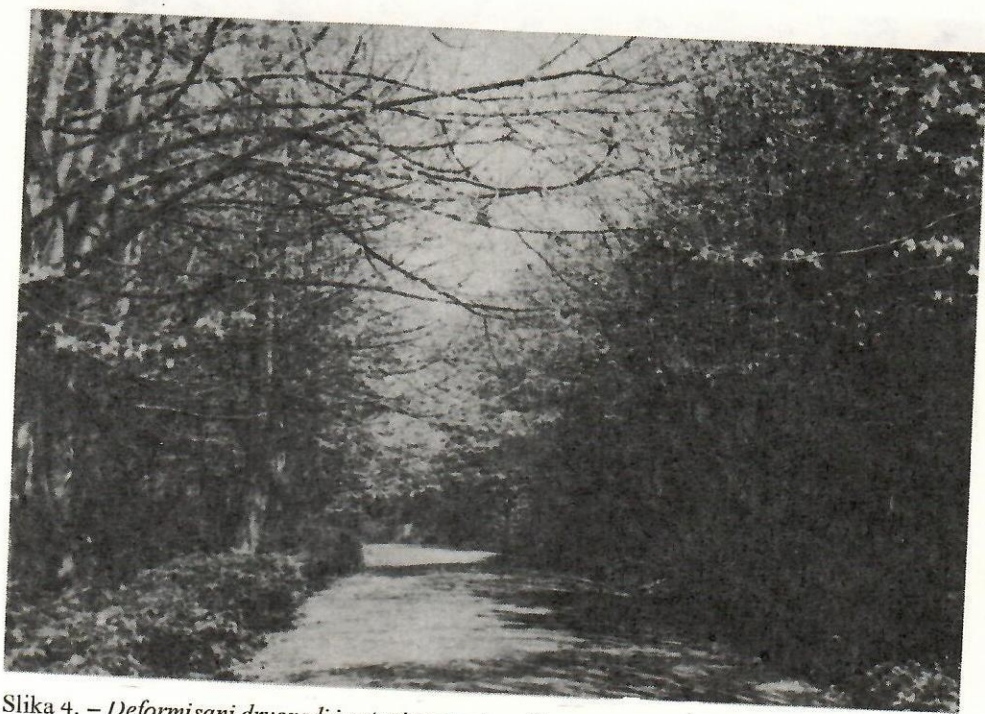
Slika 4. – Deformisani drvoređi i ostaci zastarčene žive ograde ne doprinose estetici prostora

Danas se suočavamo sa činjenicom da ovaj park deluje vrlo zapušteno čime su sve njegove potencijalne vrednosti veoma depresirane.