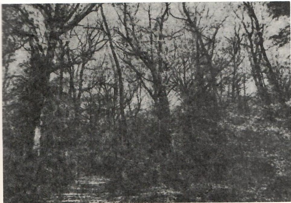
Slika 2. – Gust podrast crnog jasena, graba i drugih vrsta čini šumu neprohodnom i neprozirnom.

Skoro celom površinom je prisutan gust podrast u kome dominiraju manje vredne vrste kao što je crni jasen, grab, glog i druge, pa su i sastojine teško prohodne i kao takve nisu privlačne za izletnike i turiste.