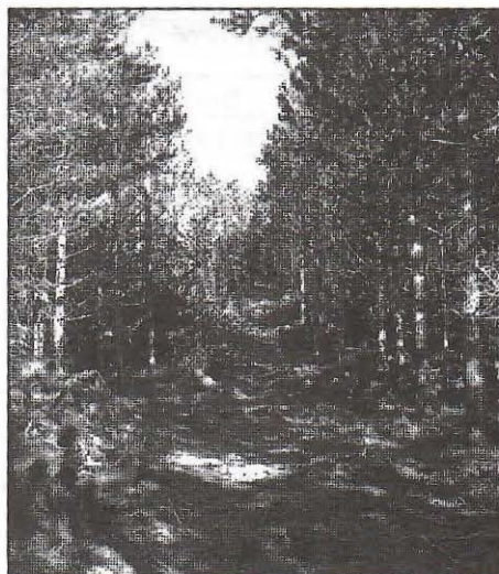
Slika 3. Traktorska vlaka i sabirna linija

Izvođenjem šematske prorede realizovan je deo planiranog prorednog etata koji je prikazan tabelarno (tabele 5 i 6)