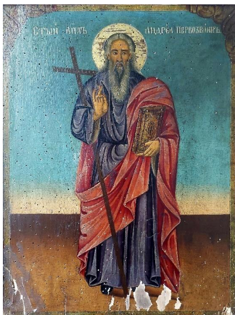
7. Свети Андреја Првозвани, Евстатије Поп Димитров, 1904.