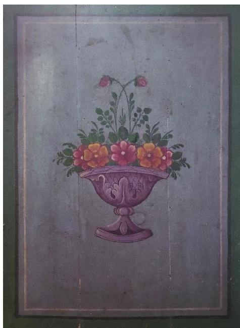
3. Унутрашња страна сокла, Евстатије Поп Димитров, 1904.