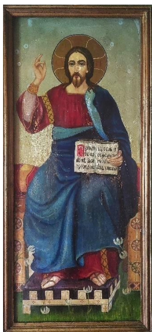
5. Исус Христос, Андреј Биценко, 3. или 4. деценија XX века