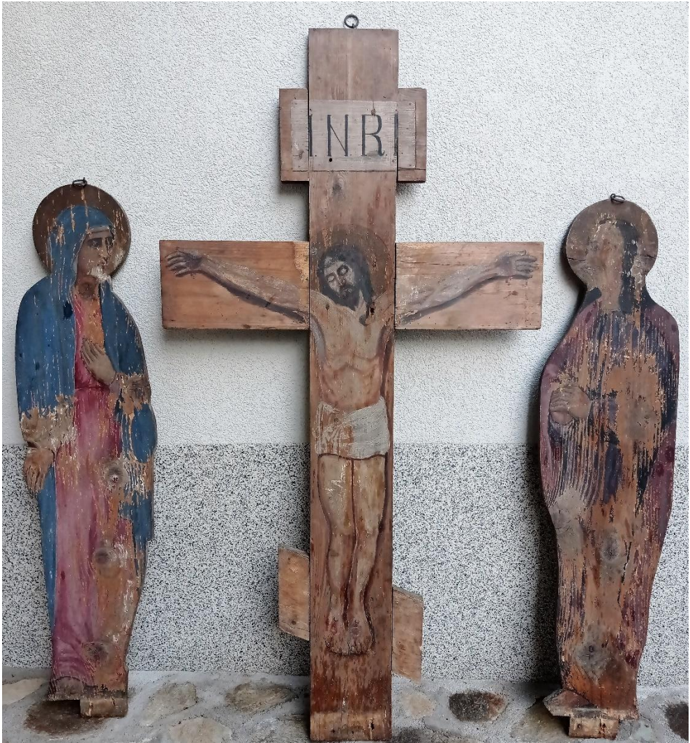
9. Запрестони крст, Андреј Биценко, 3. или 4. деценија XX века