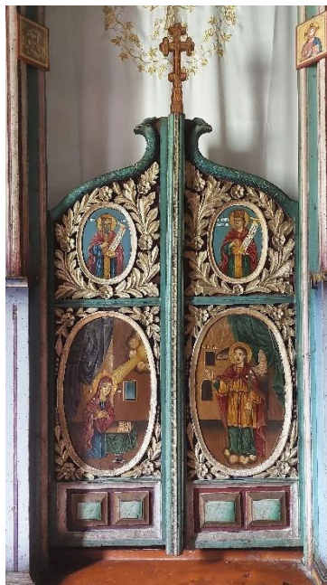
2. Царске двери, Евстатије Поп Димитров, 1904.