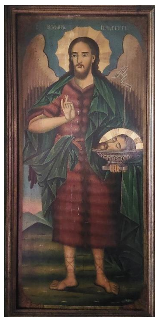
4. Свети Јован Претеча, Евстатије Поп Димитров, 1904.