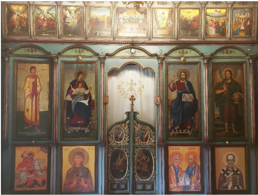
1. Иконостас у цркви Светог Георгија, манастир Ајдановац