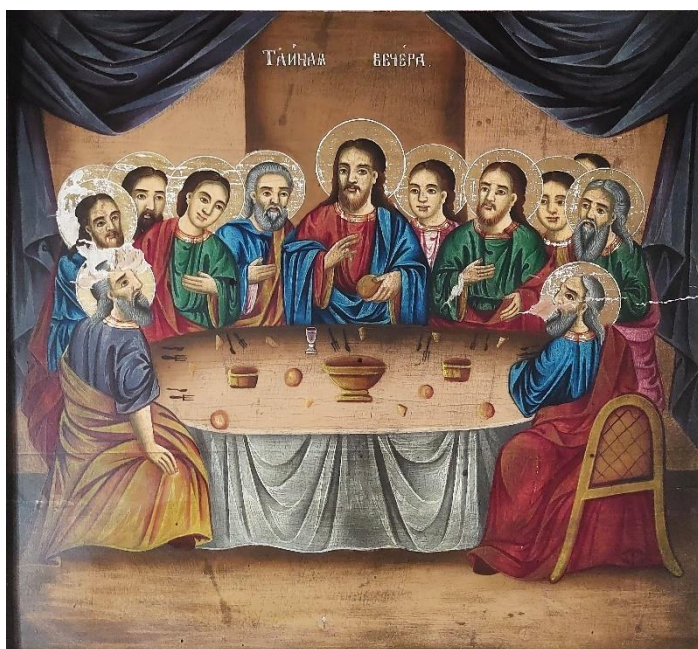
6. Тајна вечера, Евстатије Поп Димитров, 1904.