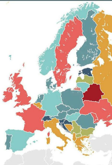
Tabela 2: Index stope kriminaliteta na prostoru Evrope za 2021. godinu 17

Kao što je već spomenuto Švedska agencija za prevenciju kriminala je 2005. godine objavila izveštaj u kome je razmotrena veza između imigracije i kriminala. U toj studiji su izneti nesporni podaci iz koji se jasno može videti da na osnovu sveobuhvatne studije veliki priliv migranata ima povezanost sa rastućom stopom kriminala. Analiza je obuhvatila nekoliko različitih kategorija krivičnih dela. Od ukupnog broja izvršilaca krivičnih dela, 58% su bili migranti. Kod krivičnog dela