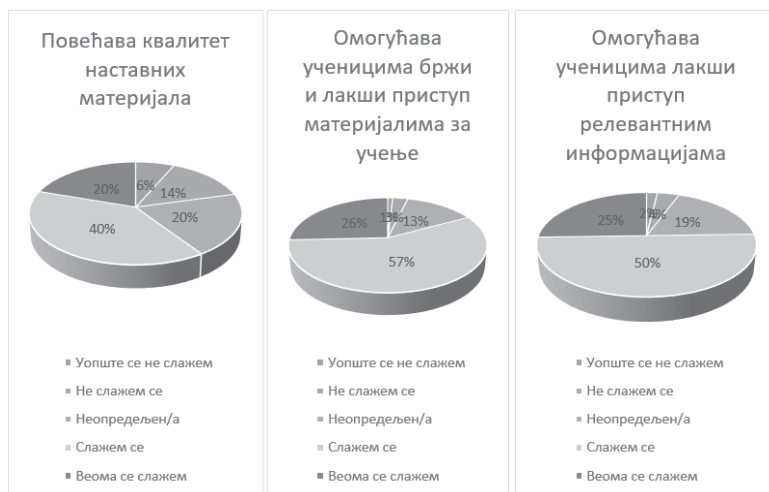
Слика 3. Бенефити наставе и учења на даљину у току пандемије (повећање квалитета наставних материјала, омогућавање ученицима бржег и лакшег приступа материјалима и релевантним информацијама)

У вези са тврђом да настава на даљину омогућава ученицима лакши и бржи приступ релевантним информацијама, наставници су се изјаснили на следећи начин: 2% наставника се уопште не слаже, 4% се не слаже, 19% наставника је неопредељено, 50% наставника се слаже док се 25% наставника у потпуности слаже се наведеним исказом.