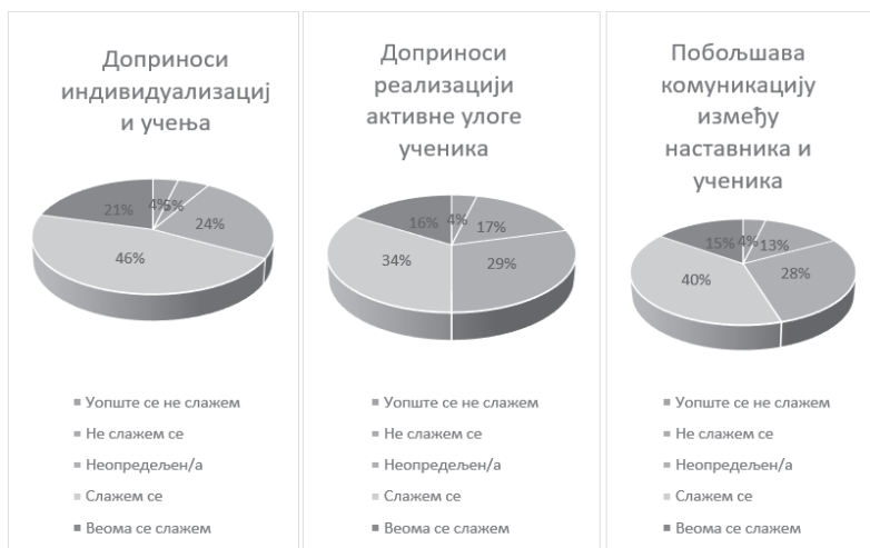
Слика 4. Бенефити наставе и учења на даљину у току пандеміје (допринос индивидуализацији учења реализацији активне улоге ученика, побољшавању комуникације између наставника и ученика)

Конечно, у вези са тврдњом да онлајн настава побољшава комуникацију између наставника и ученика у потпуности се слаже 15%, 40% испитанка се слаже, 28% је неопредељено док се 13% не слаже и 4% уопште не слаже са датом тезом.