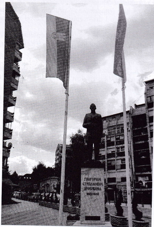
Споменик Григорија Степановича Шчербине 2