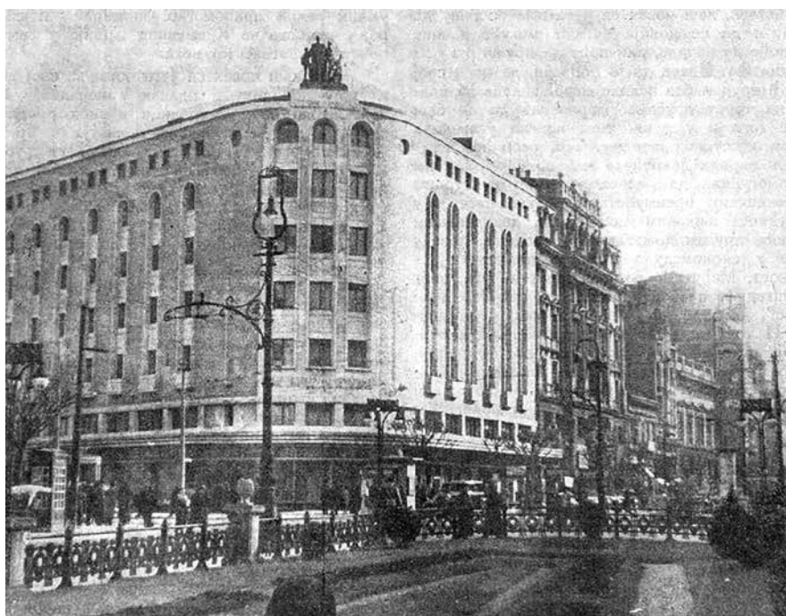
Игуманова палата, Београд 1939 ( Београдске ојштинске новине , 11. 11. 1939, 682.)