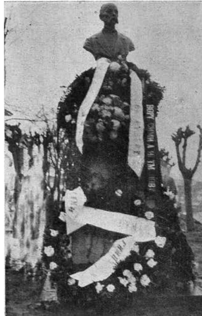
Биста Симе Андрејевића Игуманова, Призрен 1932 (П. Костић, Просветно-културни живој њавославних Срба у Призрену и њејовој околини у XIX и њочейком XX века (са усјоменама њисца) , Скопље 1933)